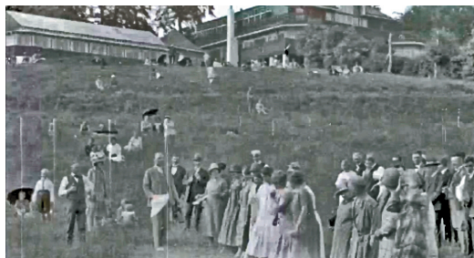
Foreningens medlemmer står klar til kapløb.

I denne lille stumfilm kan man følge, hvorledes foreningens mandlige medlemmer i følgeskab med koner og børn under udflugten til Hareskov Pavil-