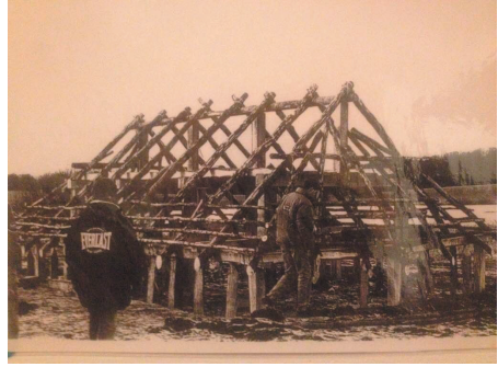
Huset inspiceret i 1995.