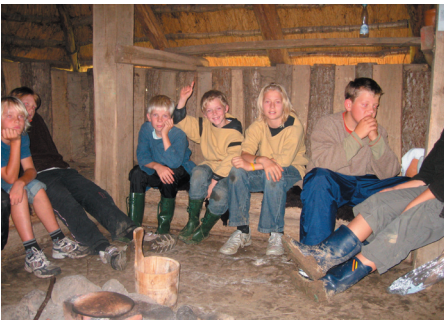
Samling i huset.