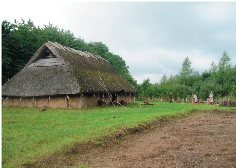
Det nye jernalderhus ved Søndersøkolen.