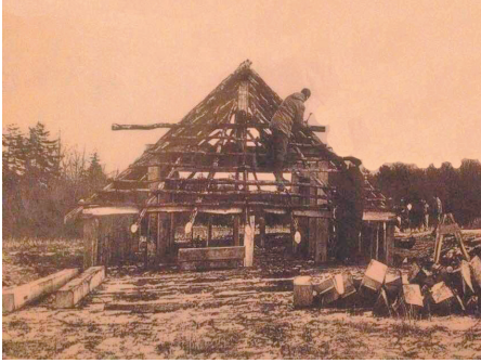
Huset under opførelse i 1995.