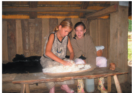
Der æltes dej.

deren på Søndersøskolen, hvor vi får dragter og bæltet på. Så bærer vi alt det, vi skal bruge, ud til huset i kurve. Først fortæller vi om huset i jernalderen, og vi fortæller selvfølgelig også om egnens meget spændende fund fra romersk jernalder. Derefter sætter vi - efter nogle selvopfundne religiøse ceremonier - Frej ned i offermosen, høvdingen blæser i gjaldrehornet, vølven spår, kaster runestaven og vi ofrer korn, hør og smør eller andet kostbart i de offerkar, klassen har med fra skolen.