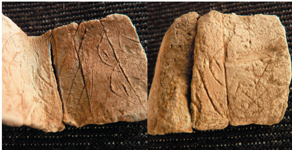
Blyamuletten fra Kr. Værløse.

Jeg havde blot et halvt års erfaring med at gå med metaldetektor, da jeg en varm sommeraften i begyndelsen af august 2013 havde fået lov til at gå ude på en høstet kartoffelmark i Kirke Værløse med min begynderdetektor. Jeg fandt stort set kun tomme patronhylstre, men også enkelte nyere mønter samt lidt blystykker - ikke noget særligt. Uerfaren - men også meget entusiastisk - tog jeg fotos af alle fund, som ikke endte i metalskrotkasserne.