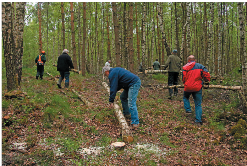
Rydning ved runddyssen i Præsteskoven 2014.

Mødested: På parkeringspladsen ved Christianshøjvej og grusvejen ind til Præsteskoven.